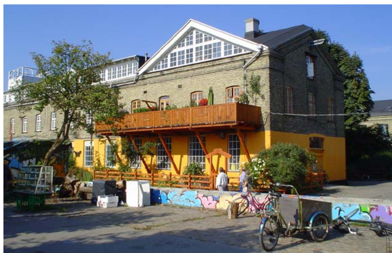
Abb. 4: Freistaat Christiania in Kopenhagen

Auf die Studenten- und Umweltbewegung, die Ende der 1960er Jahre kollektive Wohnformen für sich propagierte, übten die Kollektivhäuser keine Anziehungskraft aus. Großmaßstäbliche und industrielle Bauweise und professioneller Service passten nicht zu den Idealen einer Graswurzelbewegung, bei der das gemeinsame Planen, Bauen und Wohnen im Vordergrund stand. In dieser Zeit entstanden in Dänemark zahlreiche Wohnexperimente, bei denen das gemeinschaftliche Wohnen eine zentrale Rolle spielte. Prominentestes Beispiel der Suche nach alternativen, kollektiven Lebensformen ist der „Freistaat“ Christiania , ein ehemaliges Kasernengelände südlich der Kopenhagener Innenstadt. Es wird seit seiner Besetzung im Jahr 1971 zum alternativen Wohnen und Arbeiten genutzt, zahlreiche experimentelle Häuser sind im Selbstbau entstanden. In der dänischen Provinz, im äußersten Nordjütland, experimentierte das Thylejr mit alternativen Lebensformen in Form eines Festivals, aus dem mit den Jahren eine ökologische Dorfgemeinschaft entstand. Auch vom Thylejr gingen viele Impulse für neue Wohn- und Lebensformen aus: Vor allem im ländlichen Raum gründeten sich Kommunen und Kollektive, oft mit dem Ziel, Wohnen und Arbeiten zu verbinden und ökologisch zu leben. Das Gut Svanholm auf Seeland, das ökologische Landwirtschaft betreibt, ist ein bis heute erfolgreiches Produktionskollektiv aus jener Zeit.