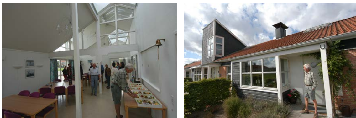
Abb. 10: Private Genossenschaft im Neubau - Seniorbofællesskab Annas Vej in Greve