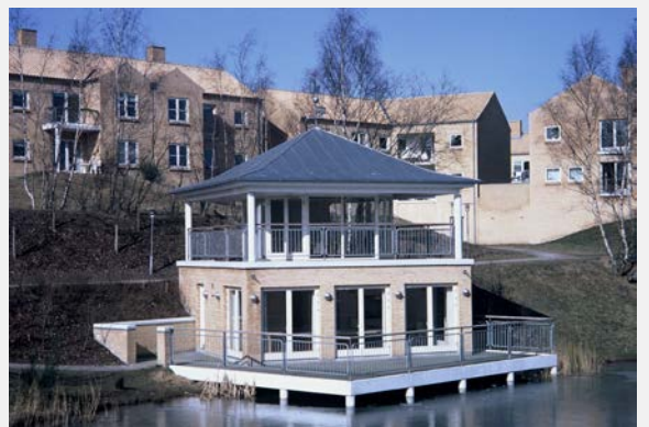
Siedlung Sandbakken in Aarhus