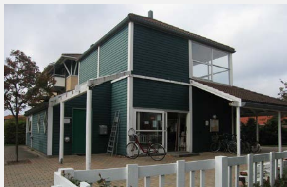
Siedlung Grønningen in Greve