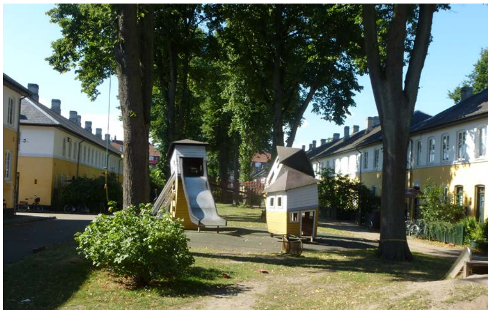
Abb. 1: Brumleby (Kopenhagen), erste Siedlung mit Gemeinschaftseinrichtungen, gebaut 1854

Dänemark hat eine lange Tradition für sozialen und gemeinschaftsorientierten Wohnungsbau zu verzeichnen. Philanthropische Vereine aus dem Bürgertum, die Genossenschaftsbewegung und die Arbeiterbewegung mit ihrer engen Verbindung zu Gewerkschaften und Sozialdemokratie machen zusammen die Wurzeln gemeinschaftsorientierten Wohnungsbaus aus, die bis in die Mitte des 19. Jahrhunderts zurückreichen. Unter dem Einfluss von philanthropischem Gedankengut aus England baute ein Kopenhagener Ärzteverein 1854 die erste Siedlung mit Gemeinschaftseinrichtungen, um die Wohnverhältnisse und den Gesundheitszustand der armen Bevölkerung zu verbessern. Anlass war eine Choleraepidemie, die im Jahr 1853 viele Kopenhagener das Leben gekostet hatte. Zu Lægeforeninges Boliger , im Volksmund Brumleby genannt, gehörten Washhäuser und ein großes Gemeinschaftshaus, in dem auch die Konsumgenossenschaft der Bewohner tagte.