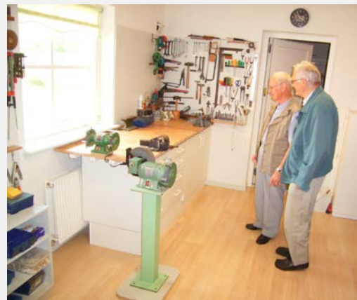
Seniorbofællesskab Toftehaven in Bov (Südjylland)