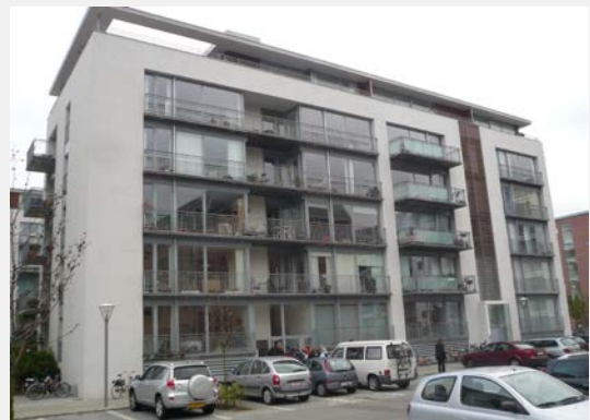
Seniorbofællesskab SamBo in Kopenhagen