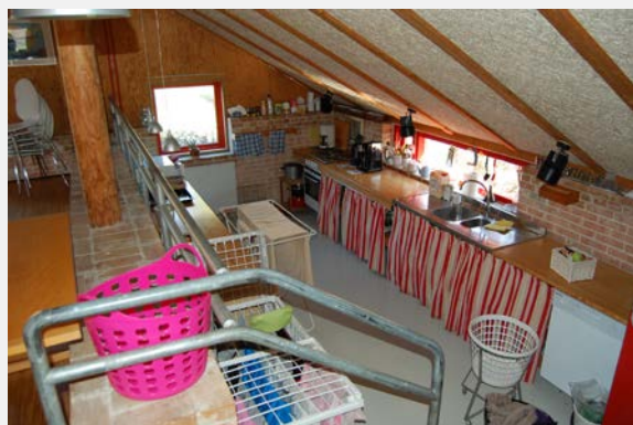
Siedlung Tinggården in Herfølge

gement bei den Bewohnern hat nicht nachgelassen. Dies ist darauf zurückzuführen, dass diese Wohngebiete bis heute Menschen ansprechen, die sich für das nachbarschaftliche Wohnen interessieren. Da die Kommunen jedoch auch hier wie im sozialen Wohnungsbau üblich Belegungsrechte für ein Viertel der Wohnungen besitzen (vgl. 2.2), ist dennoch eine soziale Durchmischung gegeben, die die Gemeinschaft manchmal auch herausfordert. Eine so große Vielfalt an Gemeinschaftsräumen findet sich in später entstandenen Wohnsiedlungen allerdings nur noch selten. Ein Gemeinschaftshaus gehört seitdem aber zur Standardausstattung eines Wohngebiets.