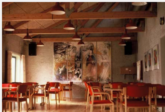
Stadtteil Egebjerggaard in Ballerup