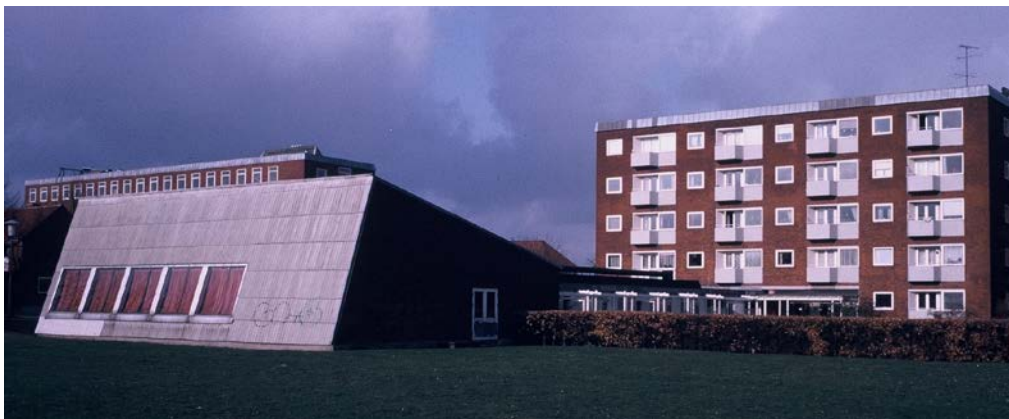
Abb. 3: Kollektivhus Høje Søborg in Søborg

Nur ein Kollektivhaus wird heute noch weitgehend auf der Basis des ursprünglichen Konzeptes betrieben: Das Kollektivhaus Høje Søborg wurde 1951 von der Wohnungsbaugesellschaft DAB gebaut. Es ist mit Küche und Speisesaal, Kindergarten, Freizeiträumen und Concierge sowie einem Lebensmittelgeschäft und einer Gästewohnung ausgestattet. Høje Søborg war ganz auf die Entlastung berufstätiger Mütter und Alleinerziehender ausgerichtet, erwies sich aber auch für alleinstehende berufstätige Frauen und für ältere Menschen als attraktiv. Die Bewohner können noch heute die gleichen Angebote in Anspruch nehmen – wenn auch in etwas reduzierter Form. Sie verpflichten sich – in einem festgelegten Mindestumfang – zur Teilnahme am gemeinsamen Essen im Restaurant. Serviceangebote und Hobbyräume werden immer noch nachgefragt. Stand in der ursprünglichen Idee der Kollektivhäuser der Servicegedanke im Vordergrund, so wird heute – von den vorwiegend älteren Bewohnern – auch die gute Nachbarschaft als vorrangige Qualität gesehen.