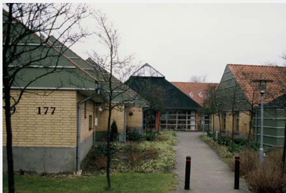
Seniorbofællesskab Det Kreative Seniorbo in Odense

Zentrum steht (vgl. 3.1). Seniorbofællesskaber essen durchschnittlich „nur etwas mehr als alle zwei Monate“ zusammen (Pedersen 2013, S. 19). Die Teilnahme ist in der Regel freiwillig, aber in einigen Wohnprojekten werden gemeinsame Mahlzeiten sehr gepflegt. „Niedrigschwellige“ Treffen wie ein wöchentliches Kaffeetrinken und das gemeinsame Feiern der Geburtstage sind in vielen Projekten üblich. Darüber hinaus werden gern kulturelle und sportliche Aktivitäten gemeinsam unternommen: Computerkurse, Fitness und Gymnastik im Gemeinschaftshaus, Besuch von Schwimmhallen und kulturellen Veranstaltungen. Das Aktivitätsniveau ist jedoch sehr unterschiedlich und die Bandbreite ist hoch. Die Bewohner der Seniorbofællesskaber verpflichten sich nicht zu gegenseitiger Hilfe, aber in der Praxis unterstützen sie sich gegenseitig bei Krankheit oder anderen Problemen.