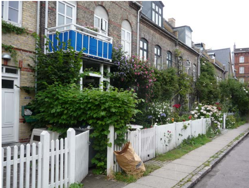
Abb. 2: Kartoffelrækkerne (Kopenhagen), 1865 gebaut vom Bauverein der Werftarbeiter

Zeitgleich mit dem Wirken der philanthropisch motivierten Vereine entstanden in der Kopenhagener Arbeiterschaft Bauvereine mit dem Ziel, in gemeinschaftlicher Selbsthilfe Wohnraum für ihre Mitglieder zu schaffen. Der erste Bauverein wurde 1865 von den Werftarbeitern gegründet. Dabei handelte es sich in erster Linie um Reihenhäuser ohne Gemeinschaftseinrichtungen, die später privatisiert wurden.