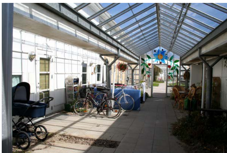
Abb. 6: Glasüberdachte Erschließungsfläche als Gemeinschaftsraum, Siedlung Skotteparken, Egebjerggaard in Ballerup