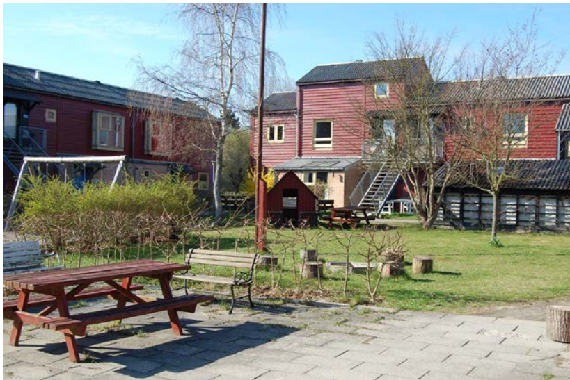
Abb.4: Siedlung Tinggården in Herfølge