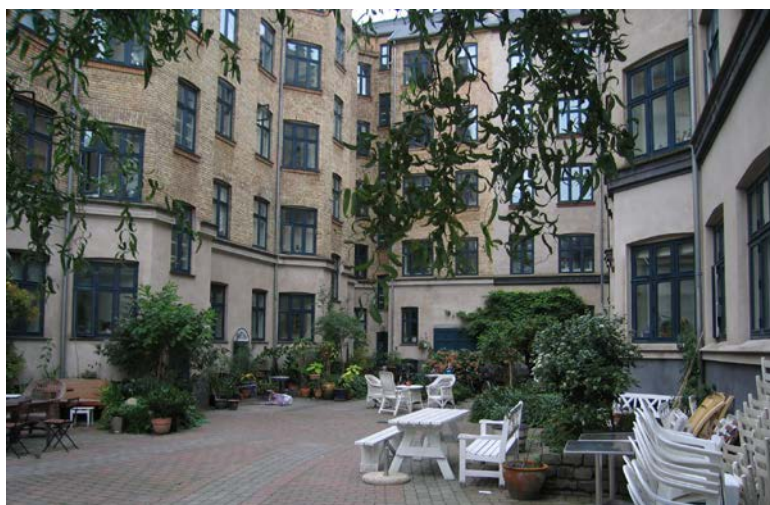
Abb. 9: Private Genossenschaft im Altbau - Skydebanen in Kopenhagen

Größere wohnungspolitische Bedeutung erlangten die Bewohnergenossenschaften erst durch eine Änderung des dänischen Mietrechts von 1976. Mit dieser wurde den Mietern ein Vorkaufsrecht eingeräumt, in dem Fall, wenn ein privater Eigentümer sein Mietshaus verkaufen will. Voraussetzung ist, dass die Mieter eine Bewohnergenossenschaft gründen. Die Rechtsgrundlage bildet das Gesetz zu Genossenschaftswohnungsvereinen und anderen Wohnungsgemeinschaften ( Lov om Andelsboligforeningener og andre Boligfællesskaber ). Dies führte im Laufe der Jahre zu mehreren Tausend Neugründungen, vor allem in Gründerzeitquartieren von Aarhus und Kopenhagen; hier machen private Bewohnergenossenschaften heute bereits die Hälfte des Wohnungsbestands aus. Dieses Vorkaufsrecht gilt auch heute noch.